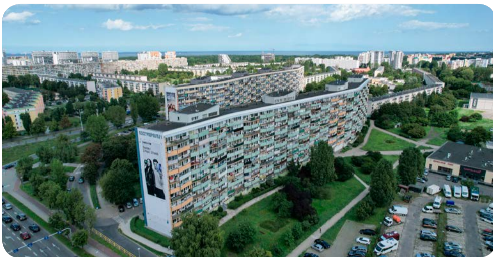
28 sierpnia proces wymiany termostatów i zaworów grzejnikowych ruszyć ma w budynku przy Rzeczypospolitej 1.

Mając na względzie kolejne podwyżki cen energii Rada Nadzorcza Powszechnej Spółdzielni Mieszkaniowej „Przymorze” zobowiązała Zarząd Spółdzielni do wdrażania działań mających na celu ograniczenie jej zużycia (w tym ciepła), a w konsekwencji ograniczenie kosztów eksploatacji mieszkania. W związku z tym podejmowanych jest wiele działań zmierzających do ograniczenia zużycia energii ciepłej i elektrycznej. Jednym z tych działań będzie wymiana starych zaworów grzejnikowych z głowicami termostatycznymi. Prace te będą finansowane ze środków pozyskanych ze sprzedaży prawa wieczystego użytkowania części działki przy ul. Czarny Dwór. Dzięki zamontowaniu nowych zaworów z nowymi głowicami termostatycznymi możliwe jest osiągnięcie nawet do 8% oszczędności ciepła, co powinno przełożyć się na opłaty.