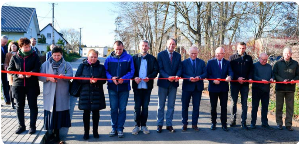
Środki europejskiej pozwoliły też na proces scalania gruntów w Trzepowie, w ramach czego przebudowano ulicę Mestwina.