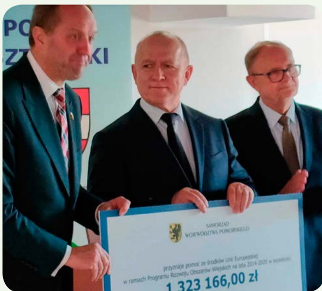
Gmina Przywidz otrzyma ponad 1,3 mln zł na przebudowę trzech dróg.