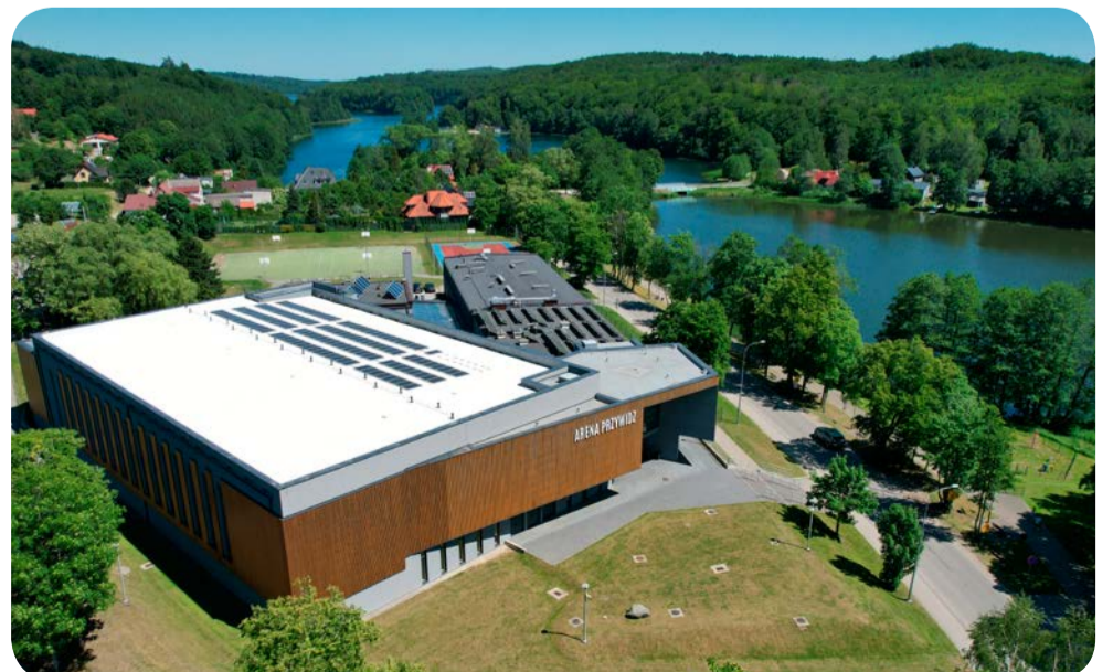
Również przy wsparciu zewnętrznych środków wybudowano Arenę Przywidz