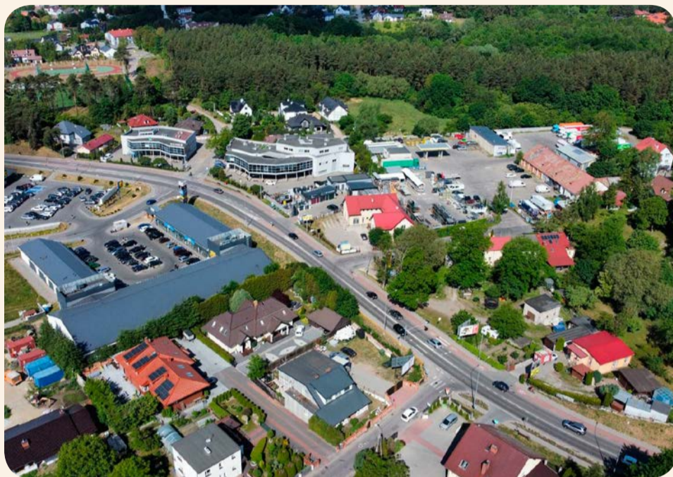
Ulica Starogardzka w Straszynie

Do końca października tego roku pojawi się w sumie 47 nowych słupów oświetleniowych: w Straszynie, Juszkwie i w Wiślinie.