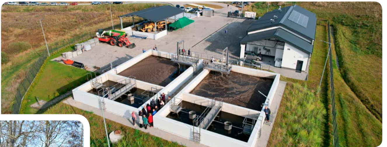
Bez dotacji z Unii Europejskiej oczyszczalnia ścieków w Piekle Dolnym nie powstałaby w tak szybkim tempie.

drogi, sieci wodno-kanalizacyjne i oczyszczalnie ścieków. – W naszej gminie, dopiero od roku 2010 zauważyliśmy namacalne korzyści płynące z wstąpienia naszego kraju w szereg Unii Europejskiej. Odnoszę wrażenie, że w latach wcześniejszych w gminie Przywidz nie było odpowiedniej atmosfery do działania. Dość powiedzieć, że do 2010 roku pozyskano ok.