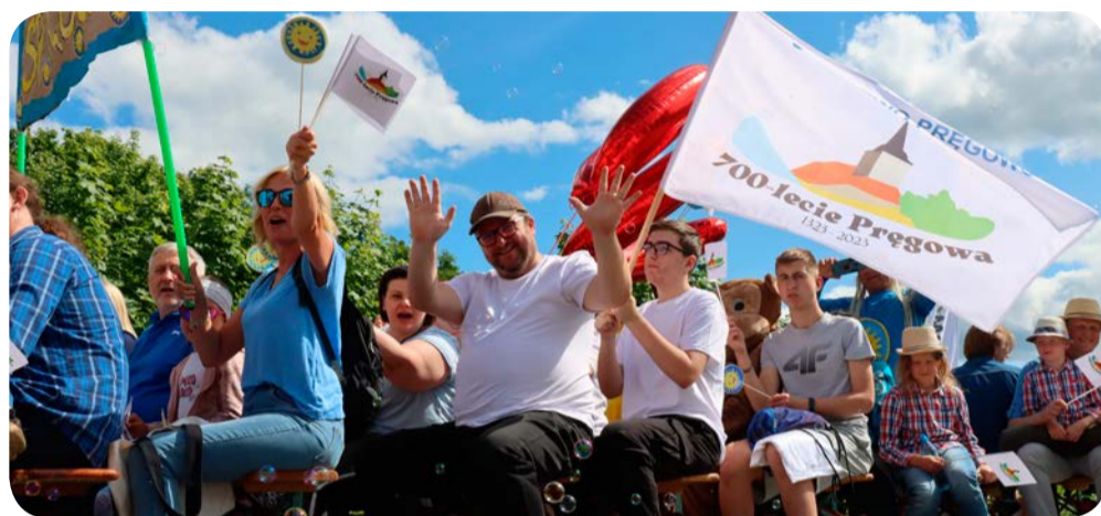
Parada ulicami Kolbud

z fanami nie stronił również „Danzel”, który również chętnie rozmawiał z mieszkańcami i pozował do zdjęć.