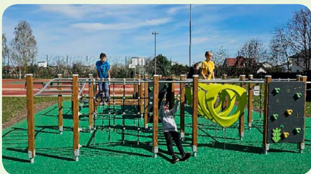
Przy pruszczańskiej „czwórce”, w ramach budżetu obywatelskiego, wybudowano otwartą strefę aktywności.

– Na przełomie czerwca i lipca przeprowadzona została ocena wszystkich projektów, na 33 zgłoszone zadania – 6 zostało