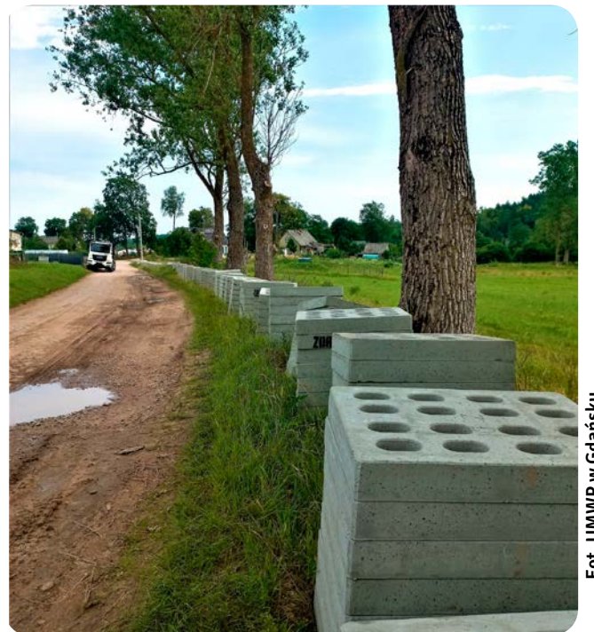
Tuż przed modernizacją ul. Cystersów w Trzепowie.

na drogi transportu rolnego otrzymało 67 pomorskich samorządów.