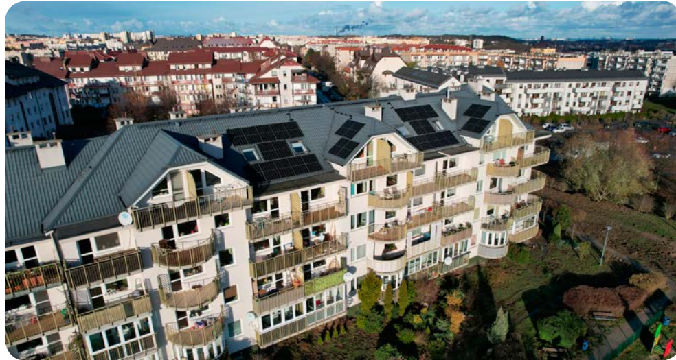
W budynku przy Platynowej 16 funkcjonować będzie nowoczesny system ogrzewania

Zarząd i Rada Nadzorcza oruńskiej spółdzielni nie składają również broni w kwestii pozyskania środków na prace termomodernizacyjne. Przypomnijmy, że wiosną walne zgromadzenie odrzuciło projekt „Wieloletniego programu remontu elewacji” (w ramach