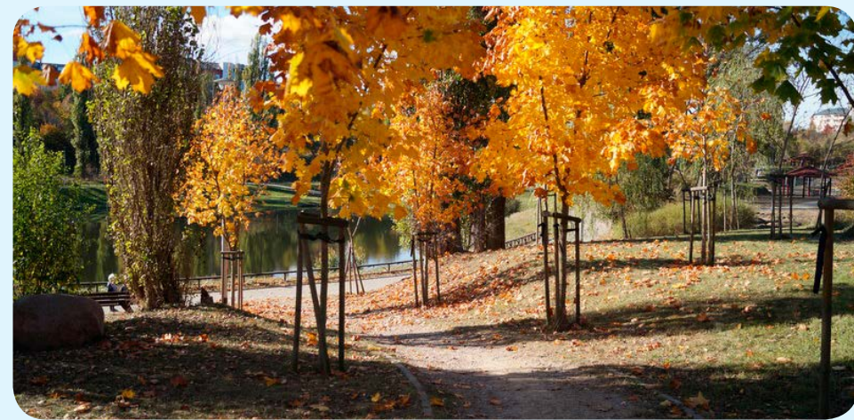
➔ Skatepark w Jarze Wilanowskim powstanie do końca sierpnia 2024 r.

Latem przyszłego roku w Jarze Wilanowskim powstanie nowy skatepark, ale na tym nie koniec. Mini-skatepark powstaje także w dzielnicy Strzyża, a w najbliższym czasie podpisana zostanie umowa na budowę takiego miejsca przy ul. Lenartowicza na Przeróbce. Wszystkie te zadania będą realizowane w ramach Budżetu Obywatelskiego.