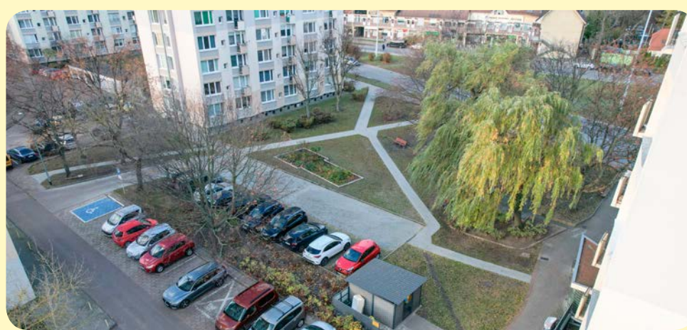
➔ Niewielki parking wykonano w tym roku między Bora Komorowskiego 85A a Śląską 37

Najdroższym tegorocznym zadaniem była naprawa konstrukcji galerii i malowanie elewacji wraz z wymianą okien (klatka