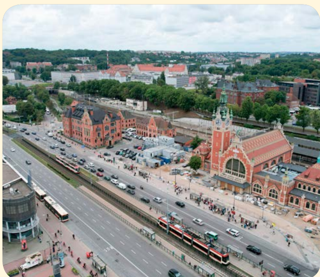
➔ W okolicy dworca PKP powstanie naziemne przejście dla pieszych