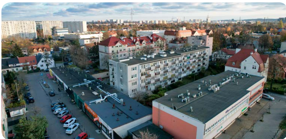
➔ Mieszkańcy niskich budynków chcieliby, aby spółdzielnia zajęła się montażem wind

– Potrzeby remontowe w tym budynku są duże i kosztowne. Musimy zająć się remontami balkonów oraz elewacji. W związku z tym tylko w przypadku tego budynku na najbliższe cztery lata fundusz remontowy zostanie podwyższony dodatkowo o 1 złotówkę od m 2 mieszkania na okres czterech lat. W tym tygodniu odbyło się posiedzenie rady nadzorczej, podczas którego omawialiśmy kwestie finansowe i doszliśmy do wniosku, że od nowego roku fundusz remontowy będzie taki sam dla budynków niskich i wysokich. Ustalono, że konieczna jest, konkretna, podwyżka odpisu na fundusz remontowy. Potrzeba