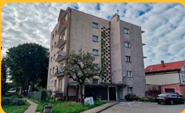
Lokal przy ul. Grunwaldzkiej 563

Robotnicza Spółdzielnia Mieszkaniowa „Budowlani” w Gdańsku – Oliwie przy ul. Grunwaldzkiej 569 posiada lokale użytkowe do wynajęcia: