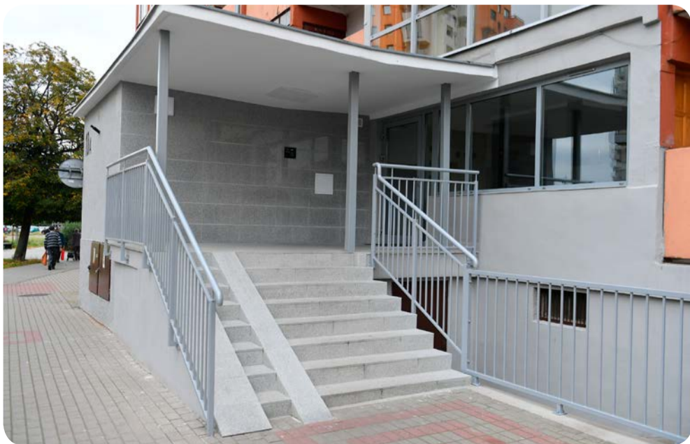
Wyremontowane wejście do klatki schodowej przy ulicy Obrońców Wybrzeża 10a

Stosując powyższe zasady, oszczędzimy energię, a tym samym dbamy o nasz budżet domowy.