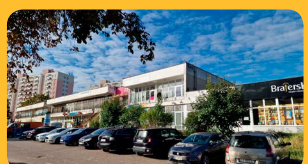
Lokal przy ul. Czyżewskiego 16

Bliższych informacji udziela się: pod nr tel. (58) 552 00 08 wew. 50, w dniach: Pon. Od 8.00 do 15.00 | Wt.-Pt. od 7.15 do 13.00