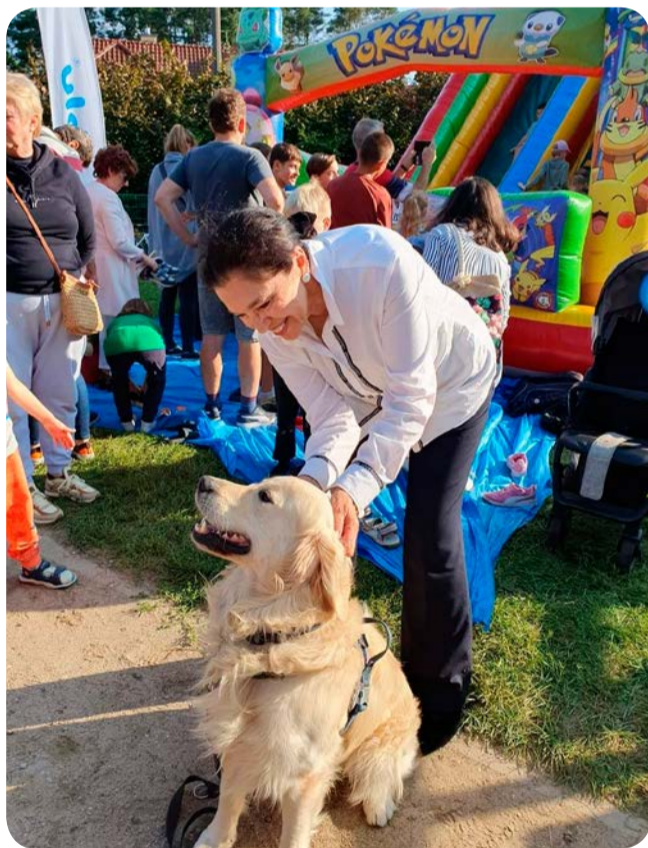
Festyn Osowskie zakończenie lata.