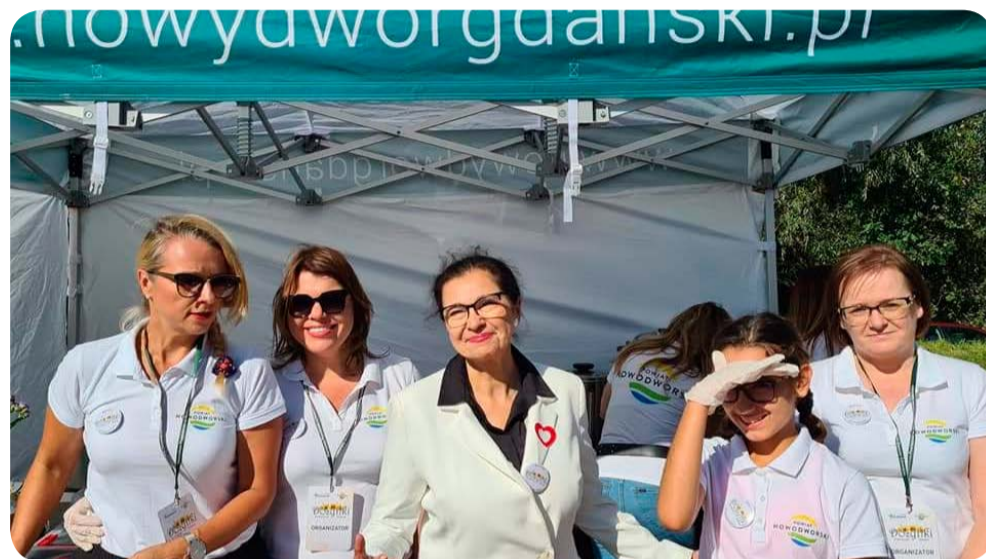
Dożynki powiatu Nowodworskiego.

– Angażowałam się w wiele projektów. Szczególnie infrastrukturalnych, gdyż – jako architekt i samorządowiec z kilkunastoletnim doświadczeniem – na takich znam się