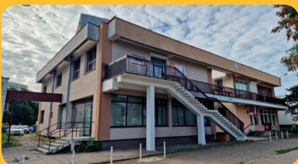
Lokal przy ul. Grunwaldzkiej 613

Stawki powyższe nie obejmują opłat z tytułu centralnego ogrzewania, energii elektrycznej, wody, wywozu nieczystości, wieczystego użytkowania gruntu, podatku od nieruchomości itp. Stawki do negocjacji.