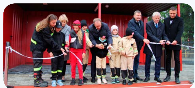
Oficjalne przecięcie wstęgi na terenie nowego obiektu