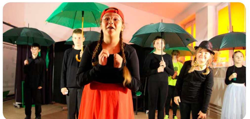
☞ Czerwony Kapturek w nowoczesnej adaptacji Teatru MaJo