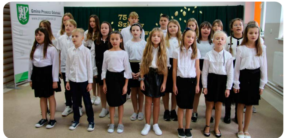
☞ Występ szkolnego chóru