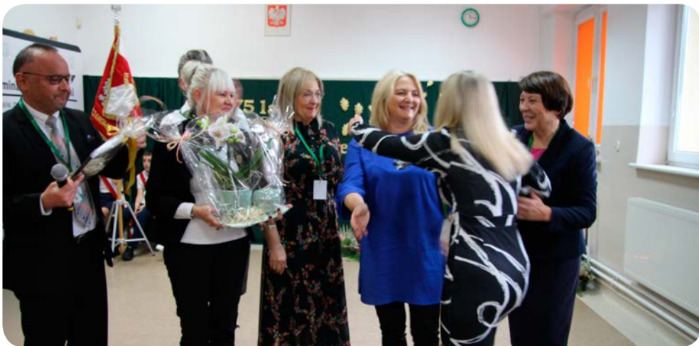
☞ Na uroczystości nie zabrakło dyrektorów gminnych placówek oświatowych