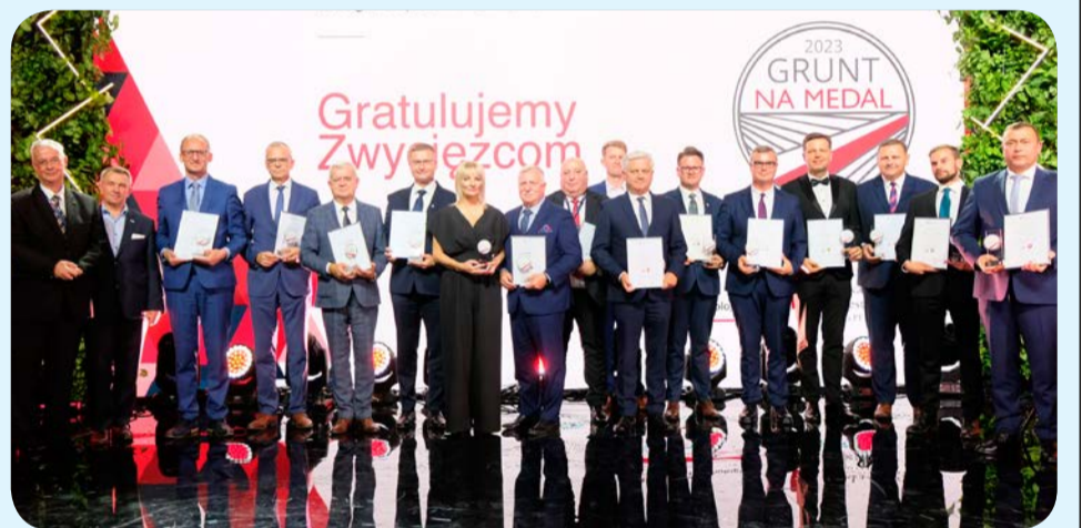
Pamiątkowe zdjęcie samorządowców, którzy odebrali nagrody w konkursie „Grunt na medal”