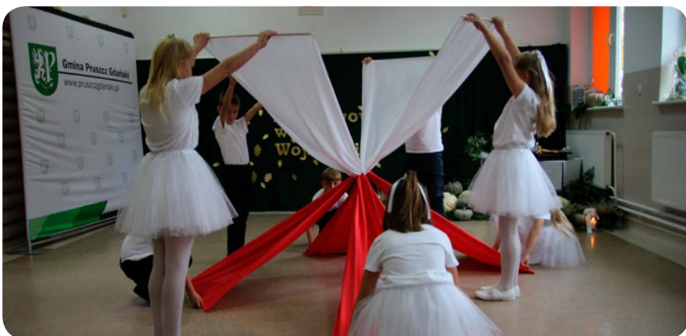
☞ Piękny i hipnotyzujący taniec ze wstęgami, które złożyły się na flagę Polski