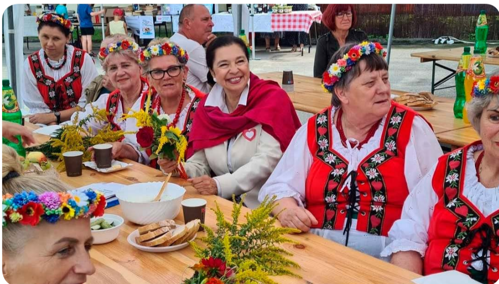
☞ Dożynki w Mikołajkach Pomorskich.