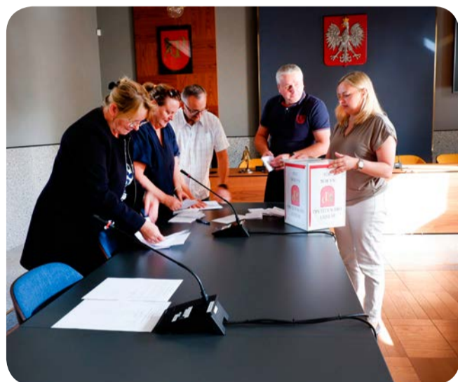
➔ Otwarcie urn z głosami złożonymi w formie tradycyjnej