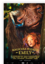
MAGICZNA PODRÓŻ EMILY