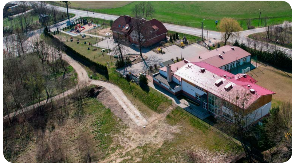
↑ Szkoła w Warczu będzie rozbudowana