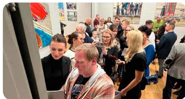
▶ Prawdziwe tłumy opanowały Dom Wiedemanna, gdzie można było oglądać prace Marka Okrassy.