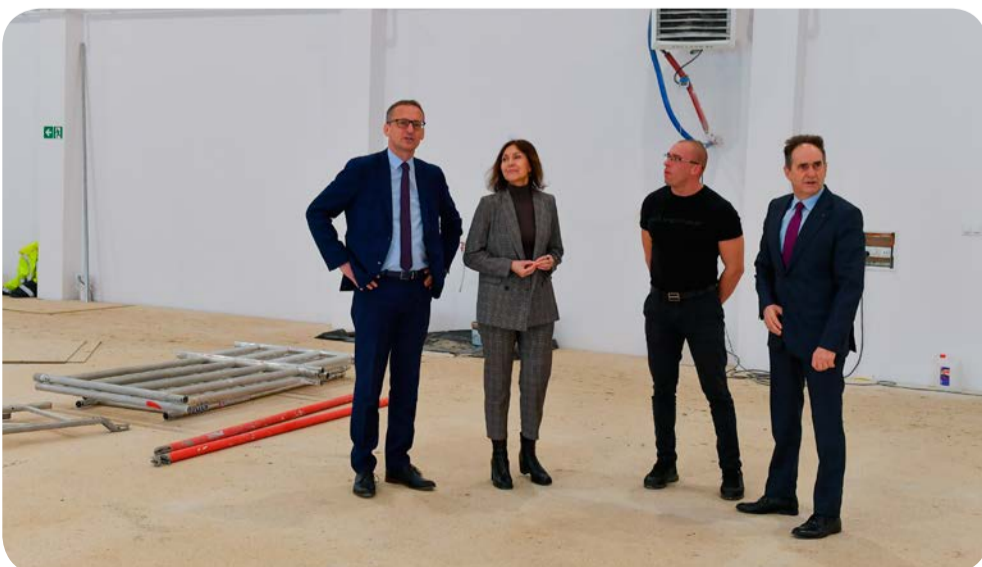
➤ Budowa sali sportowej przy „dwójce” jest już na ukończeniu