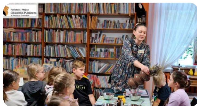
▶ W pruszczańskiej bibliotece organizowano chociażby ekowarsztaty dla najmłodszych.