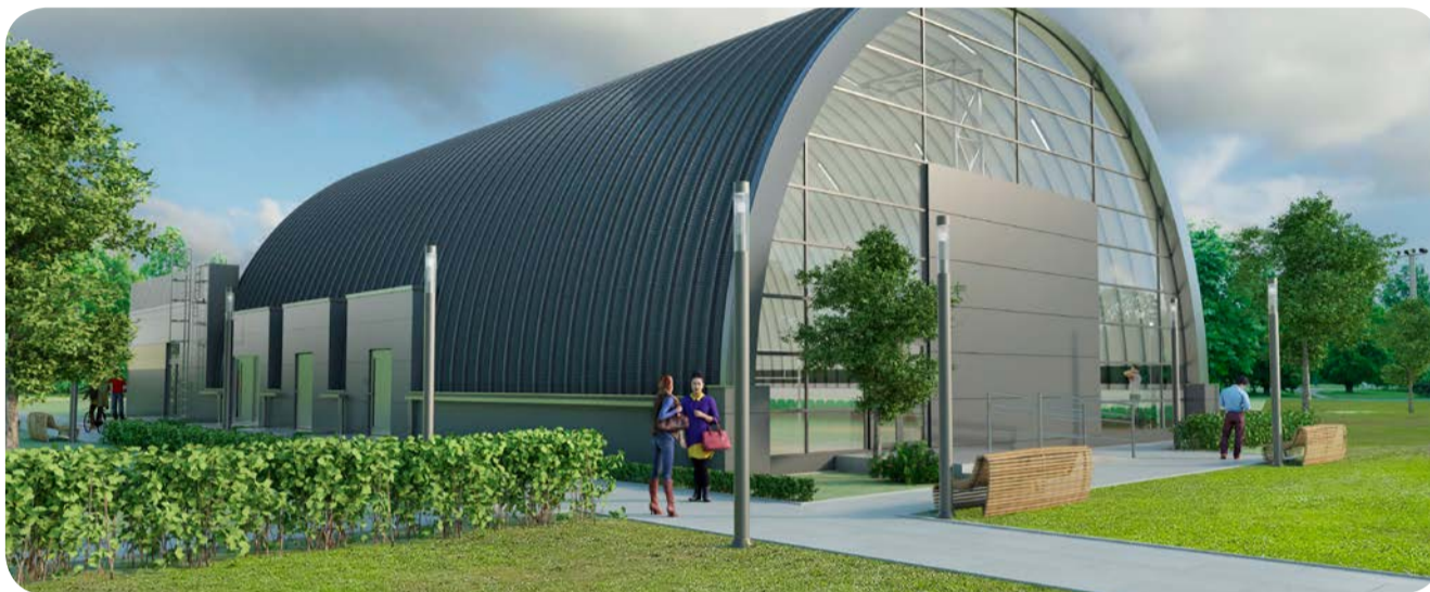
➤ Poglądowa wizualizacja sali sportowej, których budowy dofinansowywane są ze środków ministerialnych.

Przypomnijmy, że stacja uzdatniania wody jest już wykonana w Piekle Górnym, natomiast w Koziej Górze prace trwają i mają być ukończone w tym roku. Dzięki rządowym środkom budowane również będą dwie kolejne stacje uzdatniania wody w Przywidzu i Starej Hucie. Dzięki tym czterem inwestycjom mieszkańcy będą korzystać z wody, która dostarczana będzie z pięciu, a nie jak do niedawna z 13 ujęć.