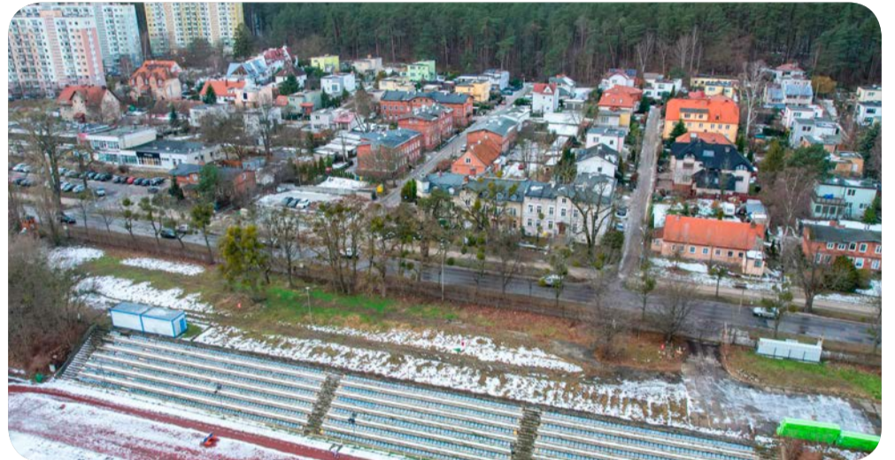
Na tym terenie powstać ma baza noclegowa zgrupowań sportowych i studenckich

– W imieniu członków spółdzielni, a szczególnie mieszkańców pobliskiego osiedla, mogę stwierdzić, że jesteśmy trochę uspokojeni odpowiedzią z Urzędu Miejskiego w Gdańsku. Rzeczywiście planowana inwestycja zaniepokoiła okolicznych mieszkańców. Mamy tylko nadzieję, że jej realizacja będzie zgodna z uzyskanymi informacjami, zarówno co do realizacji wymogów