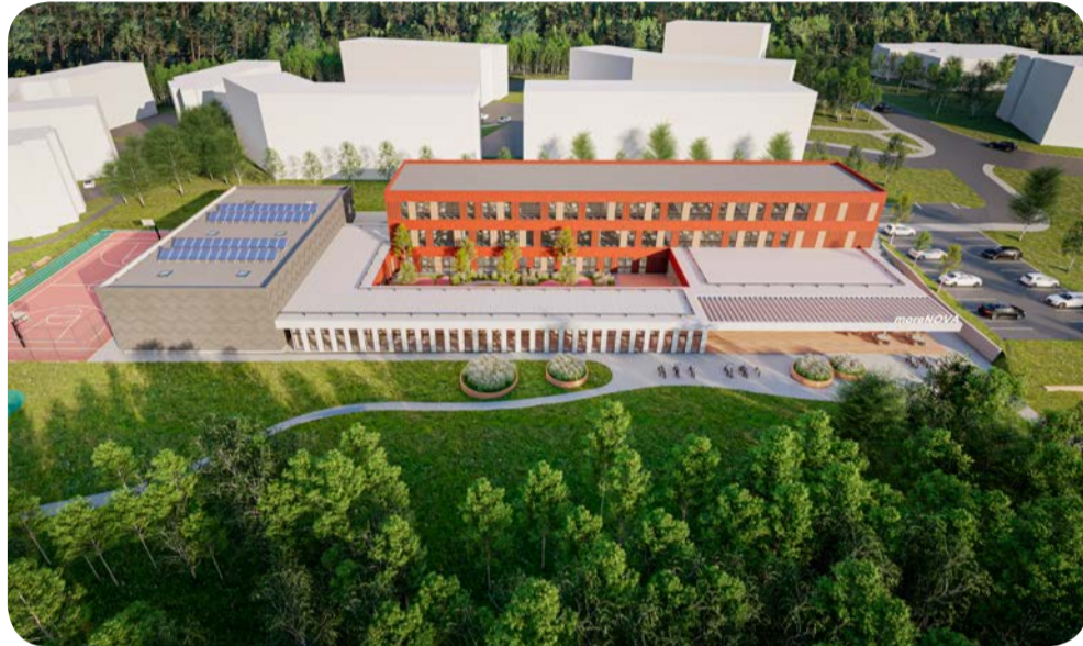
Wizualizacja szkoły przy ul. Morenowe Wzgórze

Budynek szkoły składać się będzie z trzech brył o zróżnicowanej wysokości (od 1 do 3 kondygnacji), w tym parterowej sali gimnastycznej. W centralnej części obiektu zaprojektowano wewnętrzne patio. Oprócz samego budynku przewidziano również budowę m.in. boiska wielofunkcyjnego i bieżni na 60 m. Powstanie również plac zabaw, ścieżki, a także zagospodarowane