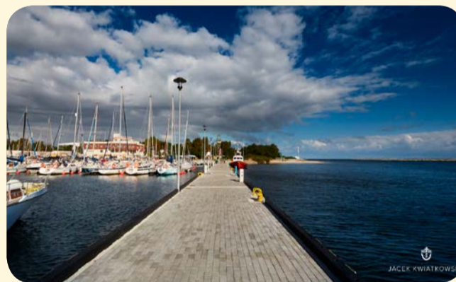
Dzięki środkom z UE rozbudowano marinę w Górkach Zachodnich

Inwestycje w ramach przedsięwzięcia żeglarskiego prowadzone były w obrębie Deltę Wisły, Zalewu Wiślanego, Zatoki Gdańskiej i Puckiej. Zbudowano i rozbudowano porty i przystanie żeglarskie w Błotniku, Wiślinie, Nowym Dworze Gdańskim,