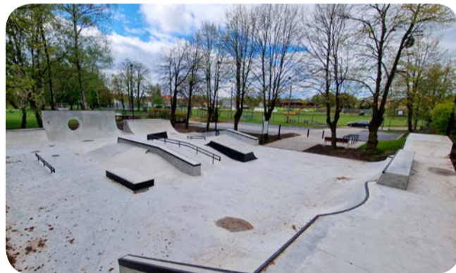
➤ Już niebawem będzie można korzystać z nowego skateparku

– Jesteśmy właśnie po otwarciu ofert na rozbudowę Szkoły Podstawowej nr 3 wraz z budową sali sportowej. Przy okazji zmienione zostanie również otoczenie „trójki”. Jest to inwestycja, która będzie zrealizowana w przyszłym