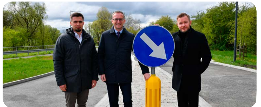
➤ Kierowcy mogą korzystać z drogi do Ciepława. Od lewej: Michał Nowak, po. wójta gminy Pruszcz Gdański, Janusz Wróbel - burmistrz Pruszcza Gdańskiego, senator Ryszard Świński

Prowadzone są intensywne prace przygotowawcze pod budowę ulicy Strzeleckiego. W związku z realizacją inwestycji władze miasta omówiły już kwestię