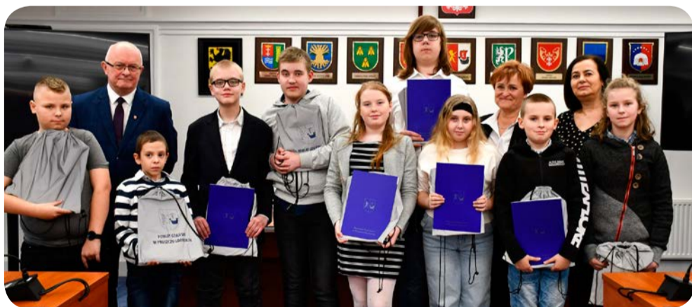
Fot. Starostwo Powiatowe w Pruszczu Gdańskim