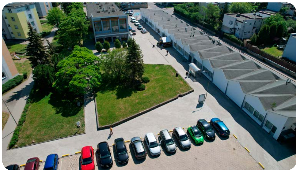
⤴ Wykonano remont chodnika przy Śląskiej 66 i nasadzono również nowe krzewy