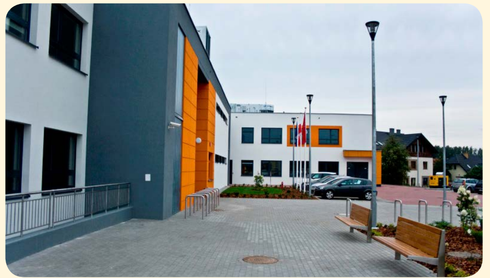
➔ Mini-rondo powstanie również na skrzyżowaniu ul. Azaliowej z ul. Kalinowej, w pobliżu Szkoły Pozytywnej.