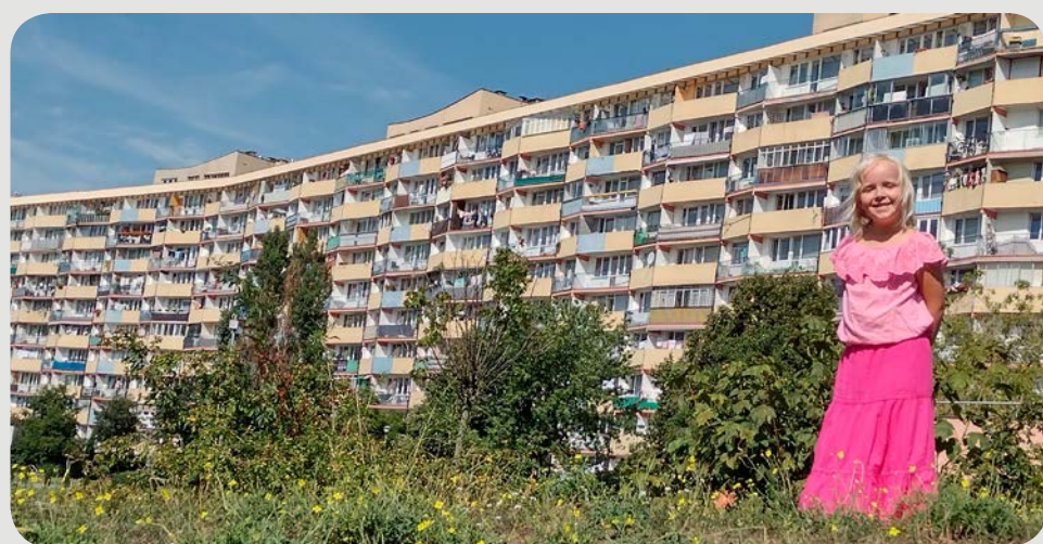
⤴ Zdjęcie z faldowcem w tle też może być urokliwe

Dom Kultury PSM „Przymorze” oraz Rada Dzielnicy Przymorze Małe zaprasza wszystkich mieszkańców Gdańska do udziału w konkursach poetyckim lub fotograficznym. Oba dotyczą Przymorza.