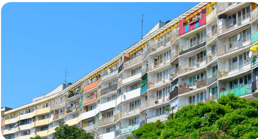
⤴ Ostatnie piętra faldowca przy Obrońców Wybrzeża są już zadane

W tym roku na prace remontowe zaplanowaliśmy około 4,3 miliona złotych. Oferowane ceny w przetargach okazały się nieznacznie, bo o ok. 5–10 procent wyższe od naszych szacunków – mówi Andrzej Narkiewicz, kierownik Administracji Osiedla nr 4. – Zajmujemy się już wymianą instalacji centralnego ogrzewania w piwnicach faldowca w klatce 4C. Z kolei w piwnicach w budynkach przy Kołobrzeskiej 45 i 47 wymieniamy nie tylko instalację ciepłowniczą, ale również wymianę izolacji i montażem nowoczesnej aparatury. Dzięki tym rozwiązaniom zmniejszymy zużycie ciepła, co wpłynie oczywiście na niższe rachunki. Jesteśmy