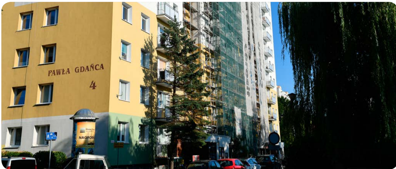
➔ W budynku przy Pawła Gdańca 4 remontowane są balkony

– Po długich poszukiwaniach udało się znaleźć firmę, która zajmuje się remontem 60 balkonów w budynku przy ul. Pawła Gdańca 4. Kolejnym ważnym elementem tegorocznych prac jest likwidacja niebezpiecznych piecyków gazowych w budynkach przy Mściwoja 61/63 i Beniowskiego 66. Jednakże są budynki, których mieszkańcy wciąż czekają na swoją kolej, by również przejść przez ten proces modernizacji – mówi nam