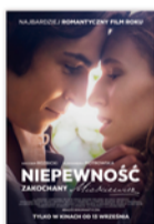
NIEPEWNOŚĆ ZAKOCHANY MICKIEWICZ