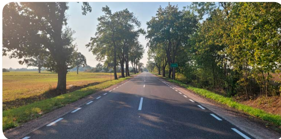
☞ Zakończono dwa pierwsze etapy przebudowy drogi Trutnowy – Osice

To jednak nie koniec inwestycji. Zgodnie z planami, realizowany będzie także trzeci etap na odcinku o długości 1,4 km. Dzięki tej inwestycji mieszkańcy i kierowcy będą mogli cieszyć się większym bezpieczeństwem na drogach w tym rejonie powiatu. Cała inwestycja kosztować będzie blisko 10 mln zł,