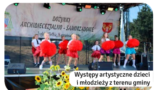
Występy artystyczne dzieci i młodzieży z terenu gminy