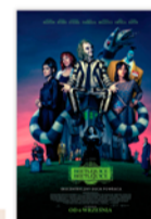
BEETLEJUICE BEETLEJUICE (napisy) 18:00