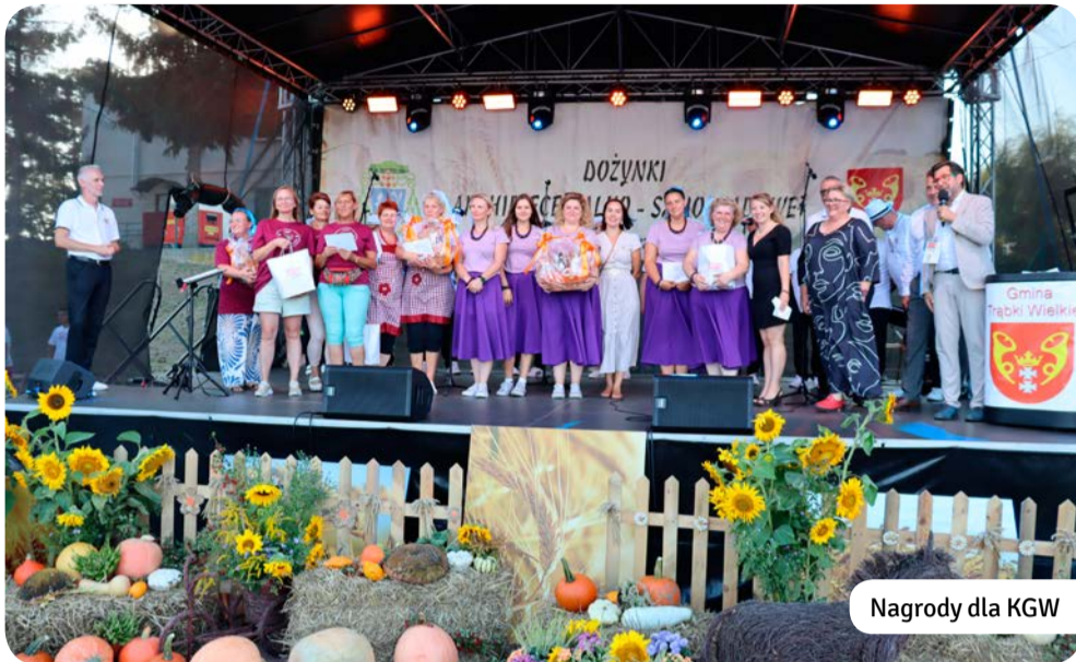
Nagrody dla KGW