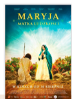
MARYJA MATKA LUDZKOSCI