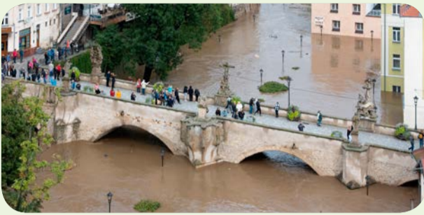
Most gotycki na Młynówce w Kłodzku

Po 27 latach od tragicznych wydarzeń z 1997 roku, wielka woda ponownie nawiedziła południowe miasta Polski. Skala zniszczeń jest ogromna – setki domów, infrastruktura drogową, mosty, uprawy rolne, a także majątek mieszkańców zostały pochłonięte przez powódź. Wiele rodzin, po raz drugi, straciło cały dorobek swojego życia, a skutki tego kataklizmu pozostaną odczuwalne przez długie miesiące.