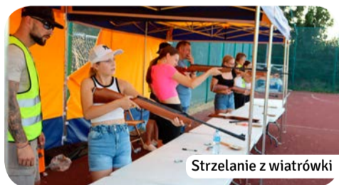
Strzelanie z wiatrówki