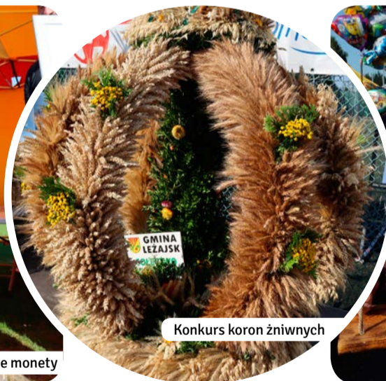
Konkurs koron zniwnych