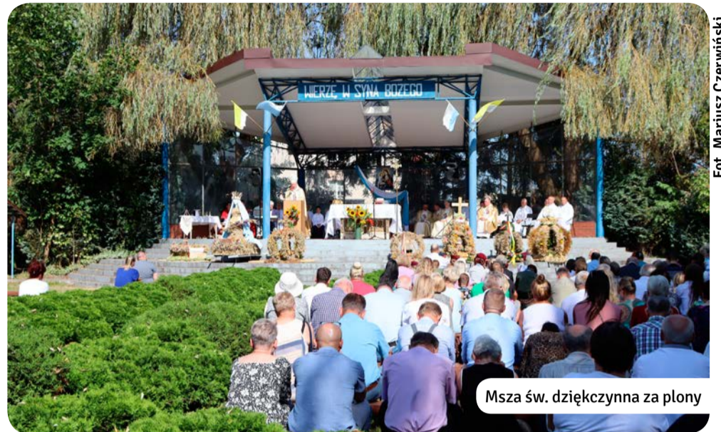
Msza św. dziękczynna za plony