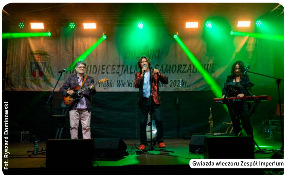
Gwiazda wieczoru Zespół Imperium