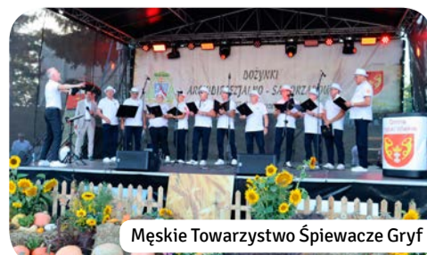
Męskie Towarzystwo Śpiewacze Gryf