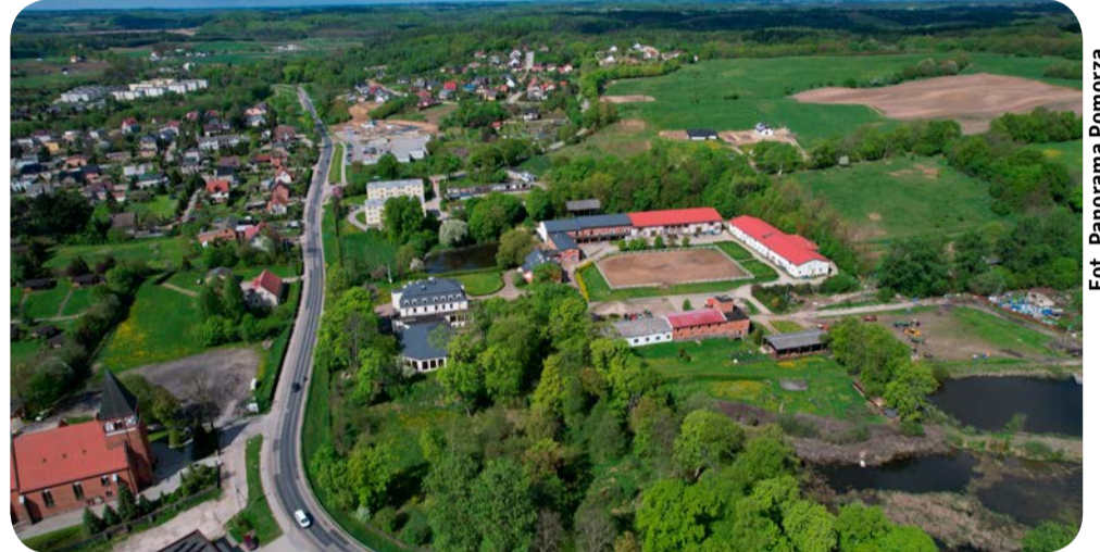
Niebawem ruszy przebudowa drogi do Kościerzyny

Rozbudowa DW221 obejmuje m.in. modernizację nawierzchni, poprawę geometrii