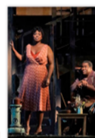
OPERA: PORDY I BESS