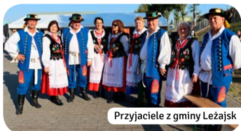
Przyjaciele z gminy Leżajsk

Gminne dożynki w Trąbkach Wielkich, które tradycyjnie rozpoczęła uroczysta msza w intencji rolników, zgromadziły licznych mieszkańców gminy, chcących podziękować za tegoroczne zbiory. Po nabożeństwie wszyscy przeszli, przy akompaniamencie Młodzieżowej Orkiestry Dętej z Kurzętnik, na plac herbowy i stadion, gdzie czekały atrakcje dla każdej grupy wiekowej. Zarówno dzieci, młodzież, jak i dorośli mogli cieszyć się zabawą, konkursami, występami artystycznymi i pysznymi regionalnymi przysmakami. To wyjątkowe wydarzenie po raz kolejny pokazało, jak ważnym elementem życia gminy jest kultywowanie tradycji i integracja społeczności.