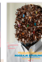
RODZAJE ŻYCZLIWOŚCI 20:00