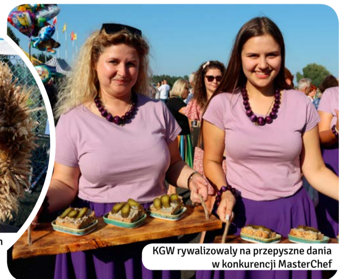
KGW rywalizowały na przepyszne dania w konkurencji MasterChef