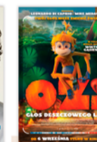
OZI: GŁOS DESZCZOWEGO LASU 18:00