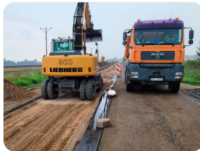
☞ Prace na jednej z dróg w Koźlinach

– Wszystkie inwestycje drogowe realizowane na Żuławach są droższe niż w innych częściach powiatu ze względu na trudne warunki gruntowe