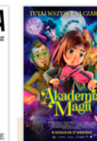
AKADEMIA MAGII 12:00 14:00 16:00