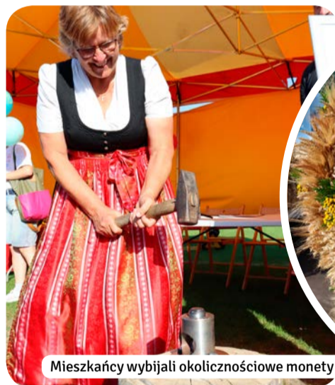
Mieszkańcy wybijali okolicznościowe monety