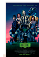
BEETLEJUICE BEETLEJUICE (dubbing) 18:00