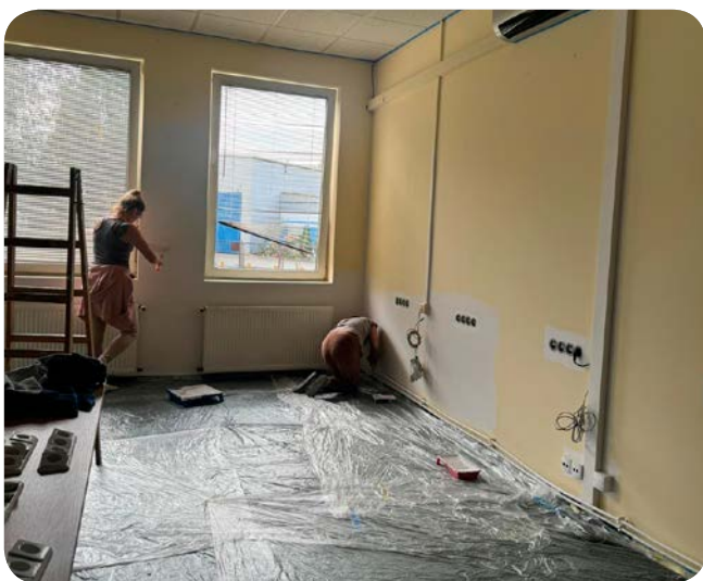
– Remontem pomieszczeń dla hospicjum zajęli się uczestnicy Centrum Integracji Społecznej