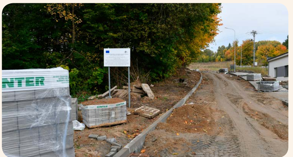
Trwa przebudowa drogi Chabrowej w Przywidzu

W sierpniu złożono wnioski o dofinansowanie w ramach Rządowego Funduszu Rozwoju Dróg. Dotyczą one budowy: ulicy Kasztanowej w Pomlewie (planowany odcinek modernizacji drogi to 1 kilometr w technologii asfaltu) oraz drogi Kierzkowo – Sucha