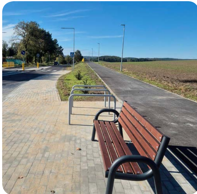
➤ Przy ścieżce Goszyn – Bielkówo postawiono także ławki

Dodajmy jeszcze tylko, że gmina Pruszcz Gdański na budowę ścieżki pieszo-rowerowej przeznaczyła ponad 670 tys. zł,