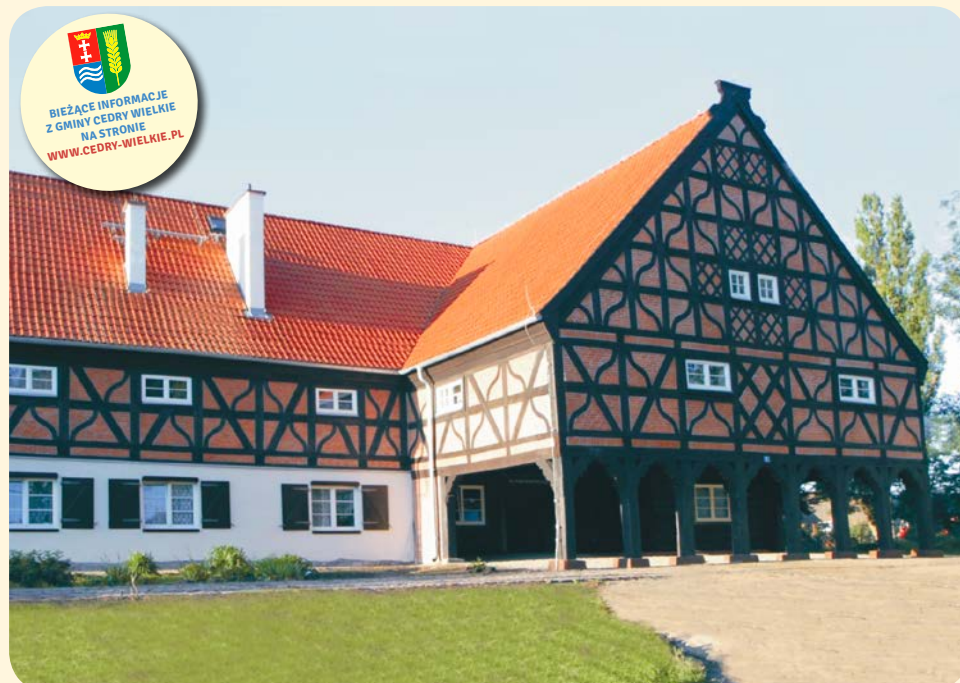
➤ Dom podcieniowy w Miłocinie