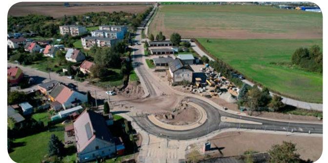
➤ Budowane rondo w Rusocinie

– Najważniejsze w tej inwestycji jest podniesienie poziomu bezpieczeństwa niechronionych uczestników ruchu drogowego, które uzyskaliśmy poprzez