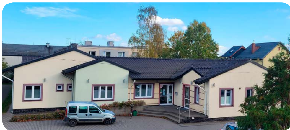
Na początku przyszłego roku będą negocjowane warunki współpracy z podmiotem świadczącym usługi medyczne w Cedrach Wielkich

– Jednym z naszych priorytetów jest pomoc w poszerzeniu oferty usług gminnej spółki Aqua Cedry. W tym celu zakupiony został m.in. beczkowóz, dzięki czemu spółka nie będzie ponosić kosztów związanych z jego wynajmem, a dodatkowo będzie mogła rozszerzyć swoją działalność. Chciałbym, aby w przyszłości była to spółka komunalna zajmująca się nie tylko sprawami wodnymi i kanalizacyjnymi. Jej pracownicy mogliby zajmować się utrzymaniem gminnych dróg, chodników, skwerów i zieleńców, a nawet dokonywali drobnych napraw gminnych obiektów. Za to wszystko w tej chwili musimy płacić podmiotowi zewnętrznemu. Wiadomo, że poszerzenie działalności wiązało się z zwiększeniem kadry pracowniczej. Myślę jednak, że mimo to działalność spółki przynosić będzie nam korzyści, szczególnie