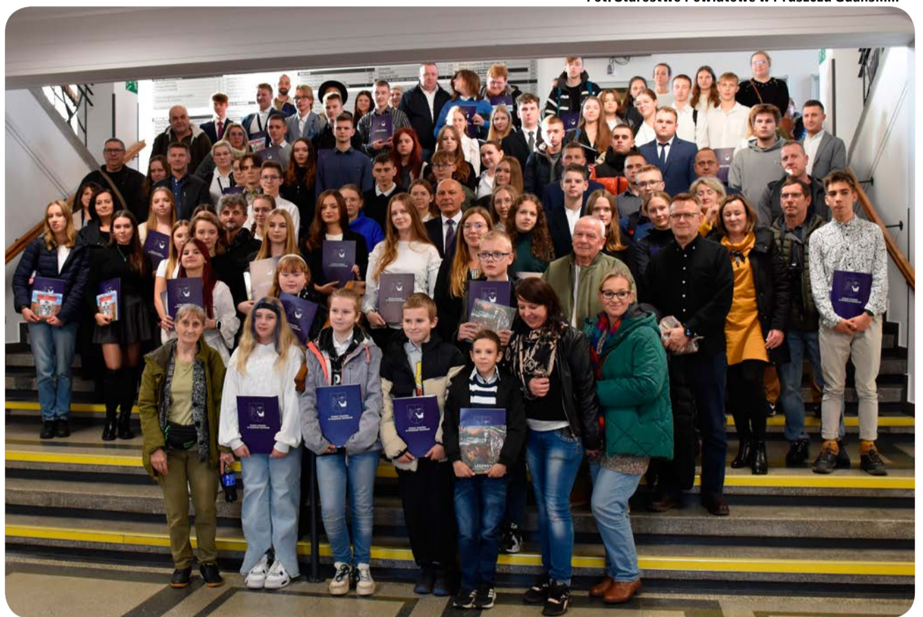
Fot. Starostwo Powiatowe w Pruszczu Gdańskim