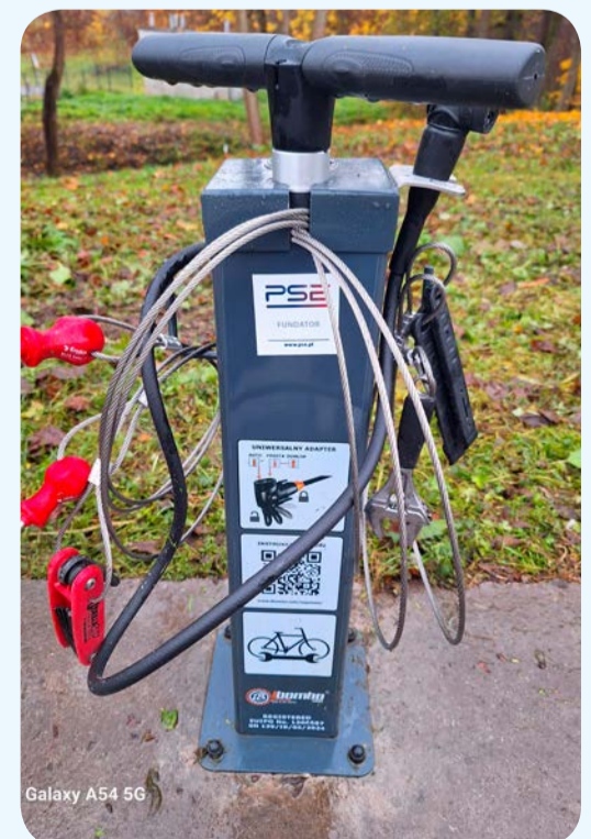
Galaxy A54 5G