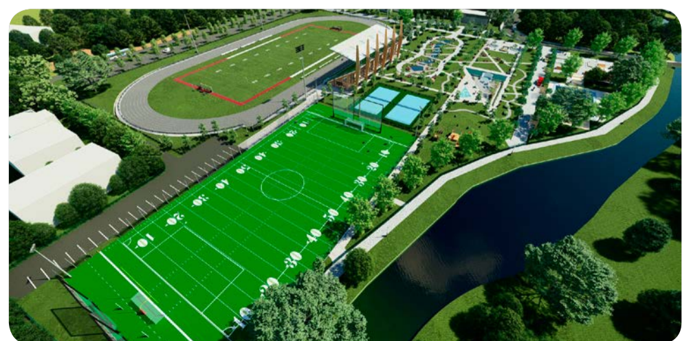
🚧 Wizualizacja przebudowanego stadionu przy CKiS

– Dlatego też od kilku miesięcy prowadzę intensywne rozmowy na temat przyszłości komunikacji kolejowej w naszym mieście. Mam tu na myśli kursy SKM do Pruszcza Gdańskiego. Znacznie szybciej wybudowany zostanie dodatkowy tor dla pociągów SKM niż powstanie linia Pomorskiej Kolei Metropolitalnej. Pociągi SKM do naszego miasta mogą dojeżdżać za 5–6 lat. Wiadomo, że dodatkowy tor na pewno powstanie, ale wspólnie