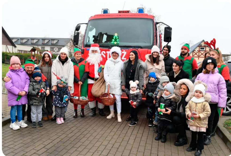
☞ Mikołaj kolejny raz nie zapomniał o dzieciach z gminy Cedry Wielkie

W tym roku Mikołaj odwiedził 26 osób, a prezenty otrzymało