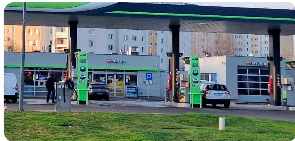
Projekt uchwały zakłada, by nocą nawet na stacjach paliw nie można było kupić alkoholu

– Podczas regularnych spotkań z mieszkańcami wielokrotnie podnoszone są zagadnienia dotyczące porządku i bezpieczeństwa wokół miejsc nocnej sprzedaży alkoholu. Wspieramy także osoby, które są dotknięte problemem uzależnienia, a także ich rodziny. Wiemy, że problem uzależnienia od alkoholu może być ograniczany w życiu społecznym przez trzy zasadnicze kwestie: dostępności, reklamy oraz ceny. Jako samorząd możemy wpływać jedynie na jego dostępność. W związku z tym postanowiliśmy zaproponować rozwiązania, które będą teraz podlegały dalszym rozmowom