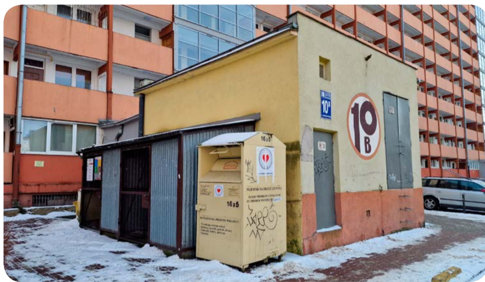
Na terenie Administracji Osiedla nr 4 postawiony jest ok. 20 pojemników, do których wrzucać można odzież.

W budynkach spółdzielczych znaleźć można informacje dotyczące nowych przepisów segregacji odpadów komunalnych.