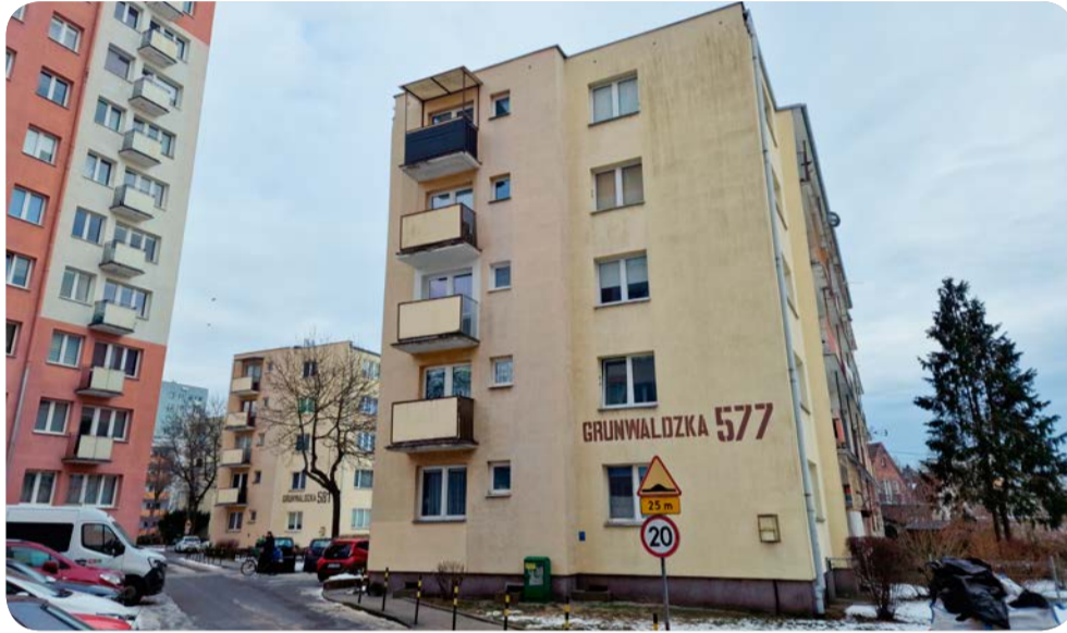
Na ten rok zaplanowano likwidację węzła grupowego i instalację indywidualnego węzła dwufunkcyjnego m.in. w budynku przy alei Grunwaldzkiej 577

Jeszcze w tym roku podobne prace mają być przeprowadzone w budynkach na Małym Przymorzu przy ul. Krzywoustego 28, gdzie obecny węzeł będzie zamieniony na dwufunkcyjny wraz z rozprowadzeniem wody. Przypomnijmy, że w ubiegłym roku właśnie na Małym Przymorzu likwidowano piecyki gazowe w dwóch budynkach, 67 mieszkaniach (ul. Beniowskiego 66 i Mściwoja