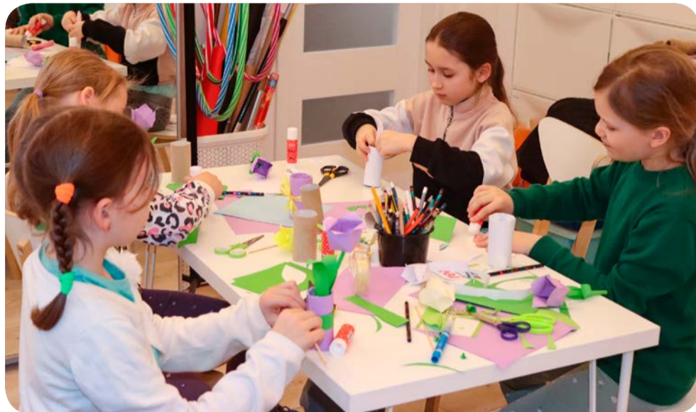
➤ Niedawno w klubie przy Opolskiej odbył się konkurs plastyczny „Wiosenne kwiaty”

Działalność osiedlowego klubu przy Opolskiej skupiona jest nie tylko na dzieciach i młodzieży. Z ciekawej oferty