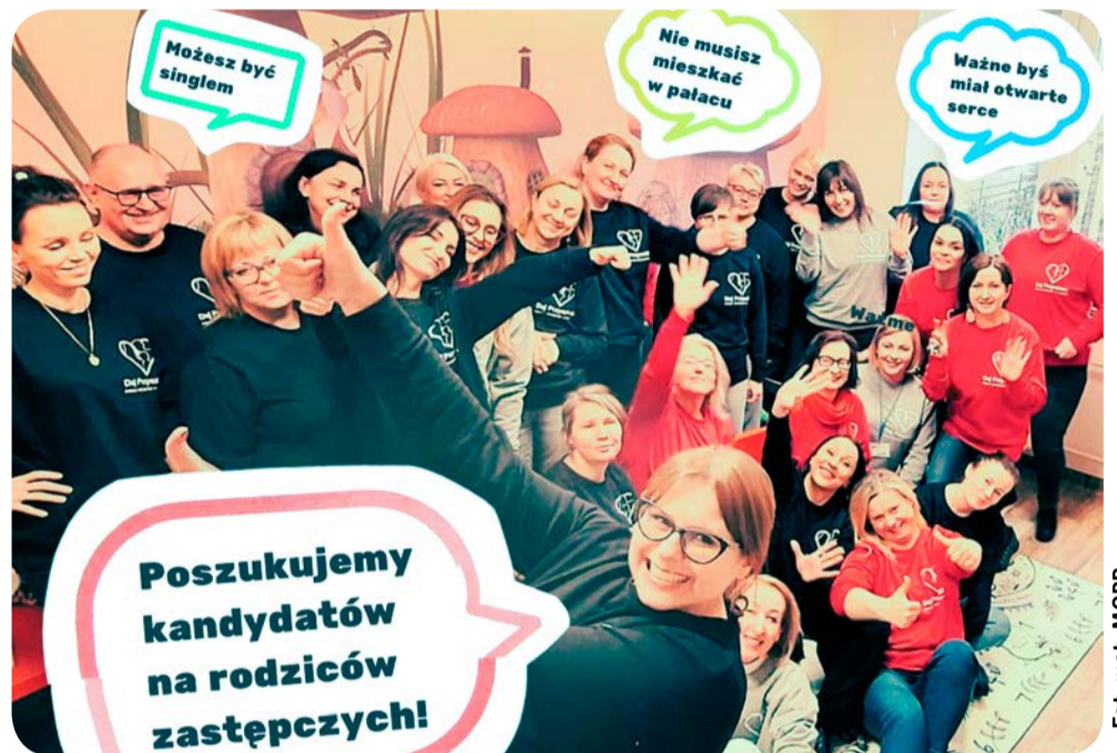
Pracowniczki i pracownicy Wydziału Pieczy Zastępczej MOPR w Gdańsku