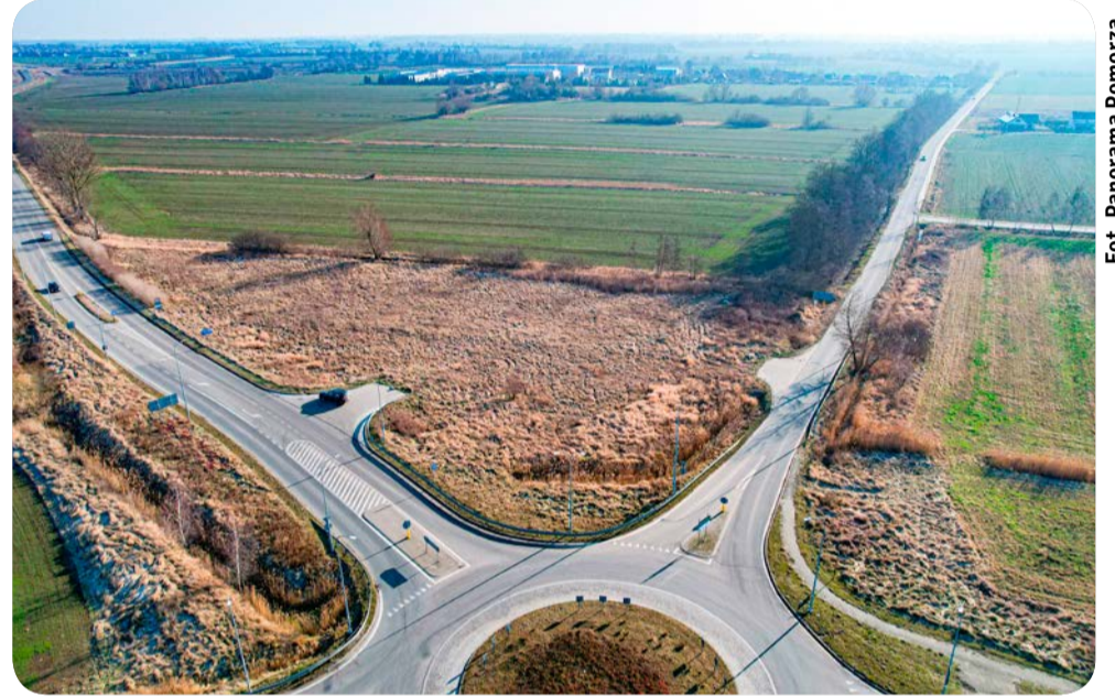
☞ Przy węźle Żuławy Wschód w Koszwałach wybudowane będzie centrum logistyczne

– Otrzymujemy sygnały, że brakuje połączeń między miejscowościami zachodniej części gminy a Pruszczem Gdańskim. W tej chwili autobus nie dociera również do Ostatniego Grosza, Trutnowych II, Serowa czy Stanisławowa. Ta ostatnia miejscowość w linii prostej leży zaledwie 10 kilometrów od fontanny Neptuna, a mimo to nie ma żadnego połączenia autobusowego z Gdańskiem. Myślę, że we współpracy z sąsiednimi samorządami jesteśmy w stanie po części rozwiązać te problemy. Jesteśmy częścią aglomeracji i nie możemy dopuścić, żeby mieszkańcy nie mieli żadnej możliwości wyjazdu busem ze swoich wsi. Metropolia jest zamknięta na część żuławską Pomorza. Koleją do Elbląga musimy jeździć przez Malbork, a przecież zdecydowanie szybciej można byłoby dojechać bezpośrednio przez Nowy Dwór Gdański. Znacznie mniejsze