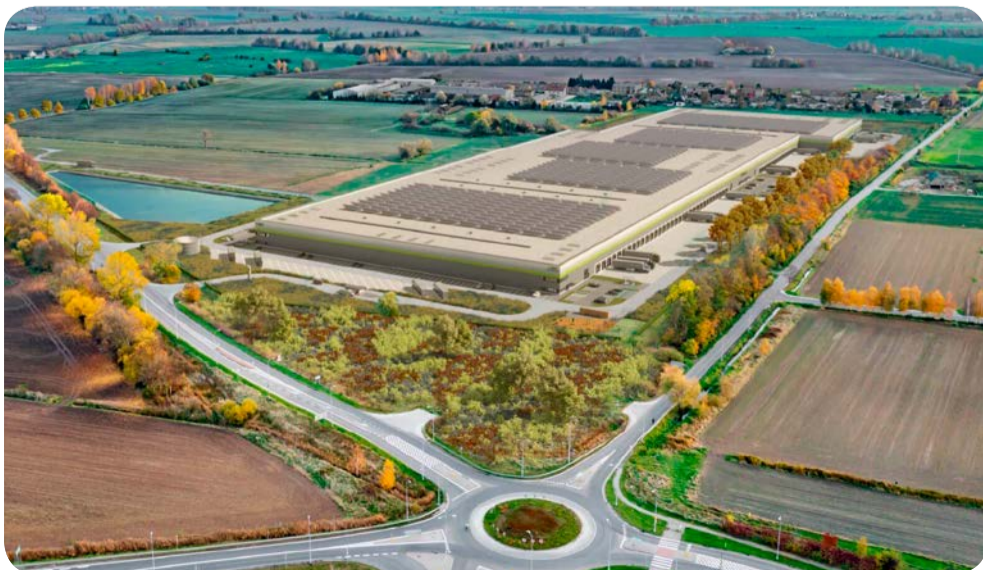
☞ W centrum logistycznym zatrudnienie zajdzie tylko na samym początku ok. 1000 osób