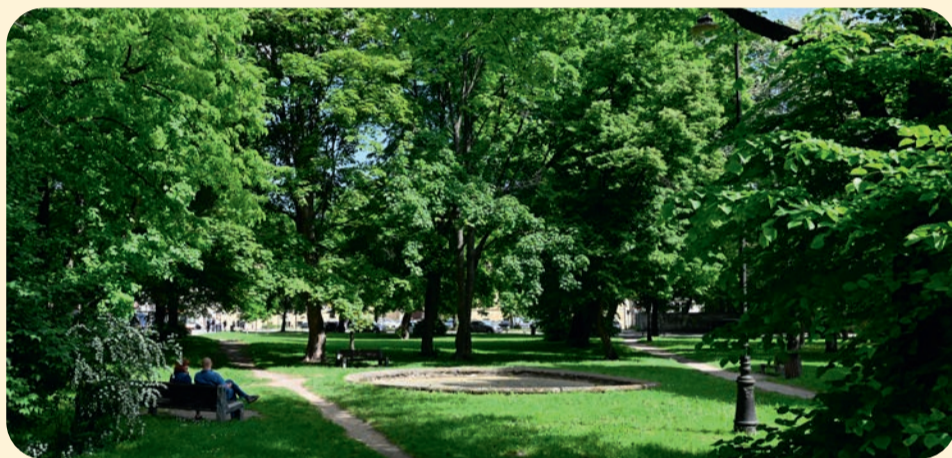
Na Placu Wałowym znów ma pojawić się historyczna fontanna