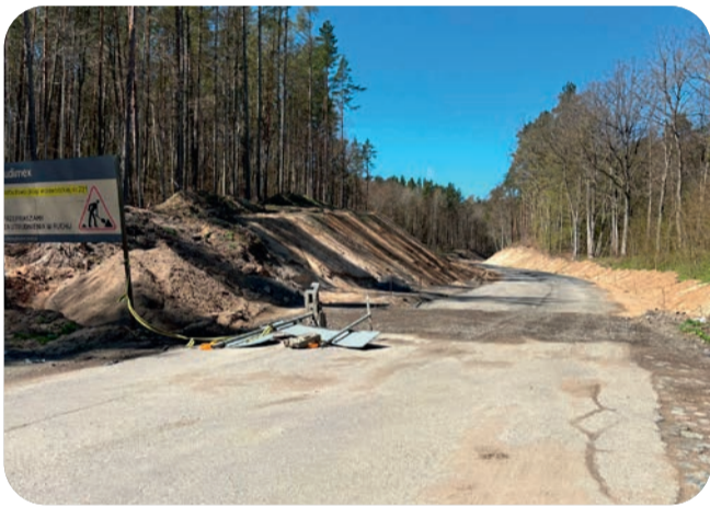
Wiosną 2028 roku ma być gotowa droga wojewódzka Gdańsk – Kościerzyna.