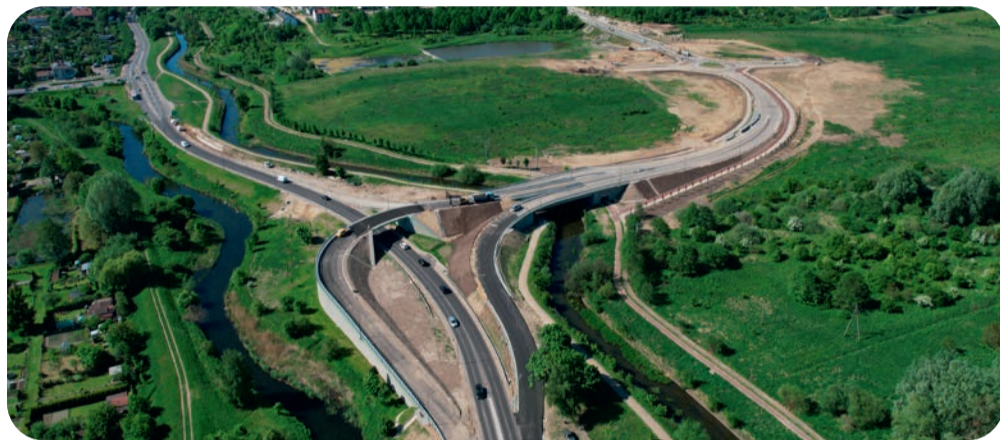
Ulica Strzeleckiego jest już niemal gotowa. Droga ma być oddana do użytku we wrześniu

Kilka dni temu podpisano także umowę na budowę ulicy Miłosza oraz rozbudowę ulicy Herberta. Inwestycja pochłonie