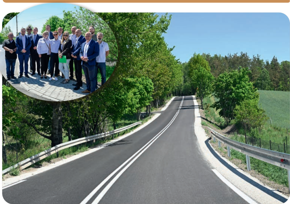
Przebudowana droga Jodłowno - Roztoka

Zakończyła się jedna z większych inwestycji drogowych realizowanych w ostatnich latach na terenie gminy Przywidz. W poniedziałek odbył się oficjalny odbiór przebudowanej drogi powiatowej między Roztoką a Jodłownem. Prace objęły blisko 10 kilometrów trasy.