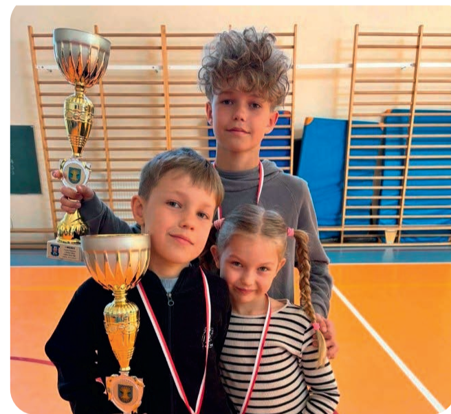
📌 Turnieje o puchar wójta

Ważnym elementem wsparcia młodych sportowców jest również przyznawanie stypendiów sportowych za osiągnięcia sportowe. W 2026 roku stypendia wójta otrzymały 33 osoby wyróżniające się wynikami sportowymi oraz zaangażowaniem