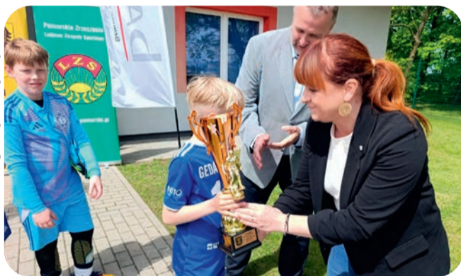
📌 Turnieje o puchar wójta

– w szachach oraz piłce nożnej. Wydarzenia przyciągnęły wielu uczestników oraz mieszkańców kibicujących zawodnikom. Przed nami jeszcze turniej unihokeyja i zmagania tenisistów stołowych.