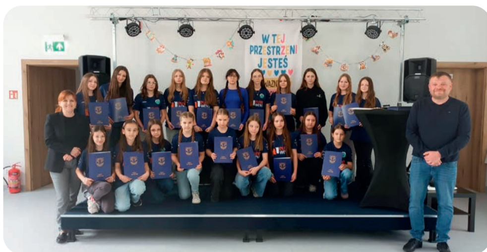
📌 Rozdanie stypendiów wójta gminy Suchy Dąb

Dzięki dotacjom, jakie otrzymały lokalne kluby, możliwa jest organizacja wydarzeń sportowych promujących aktywny styl życia. W tym roku odbyły się już dwa turnieje o „Puchar Wójta Gminy Suchy Dąb”