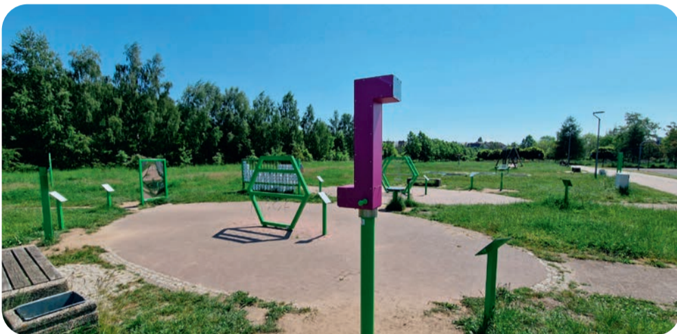
➤ Spora część projektów dotyczy parków...