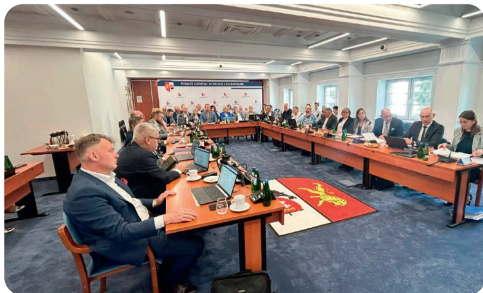
☞ Sesja absolutoryjna