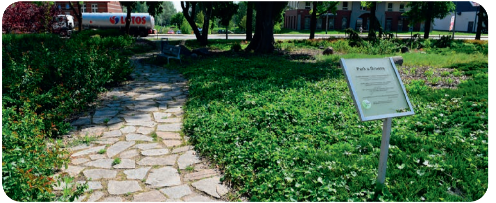
➤ ... i terenów zielonych

Dużym zainteresowaniem cieszą się także projekty związane z aktywnością fizyczną i integracją mieszkańców. Wśród zgłoszeń znalazły się propozycje utworzenia strefy gier, budowy kortu do padła czy pumptracku. Część inicjatyw dotyczy ponadto zwiększenia bezpieczeństwa, poprawy dostępności i estetyki miasta, a także edukacji historycznej oraz wzmacniania lokalnej tożsamości.