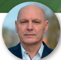
☞ Jarosław Karnath, starosta gdański

W Rusocinie przebudowano około 650 metrów drogi między rondami, uporządkowaniem rowów odwadniających i montażem wygrodzeń zabezpieczających pieszych. W Żukczynie wykonano kanalizację deszczową, a także dojeżdżenie do przejścia dla pieszych. W Pręgowie, Żukczynie, Rokitnicy i Domachowie pojawiły się nowe progi zwalniające. Wykonano także przebudowę mostu w Krzywym Kole, obejmującą rozbiórkę starego obiektu i budowę nowej przeprawy. Inwestycja kosztowała blisko 786 tys. zł, z czego 377 tys. zł to rządowe dofinansowanie.