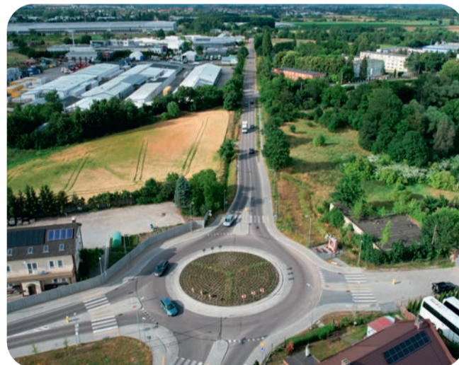
☞ Przebudowany odcinek drogi między rondami w Rusocinie