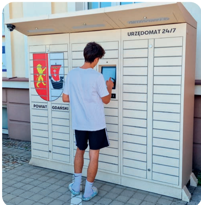
☞ Petenci chętnie korzystają z urzędomatu, który uruchomiło Starostwo Powiatowe